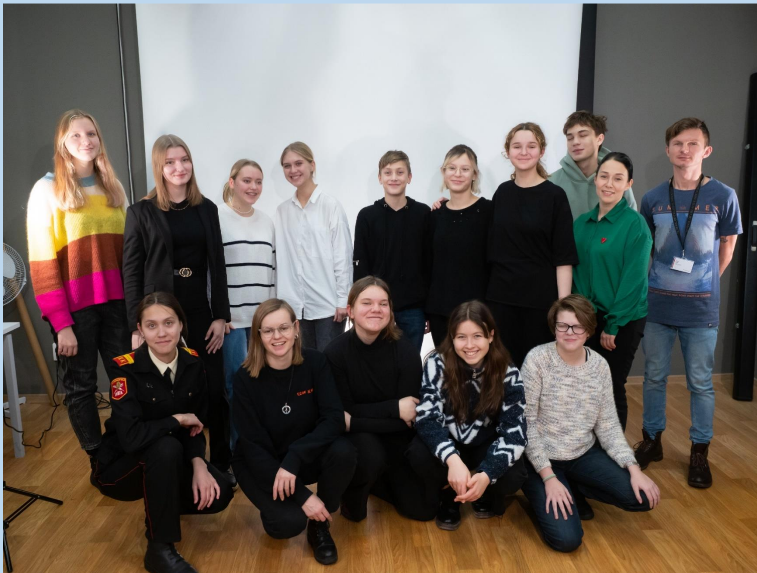
Некоторые участники, кураторы и педагоги проекта