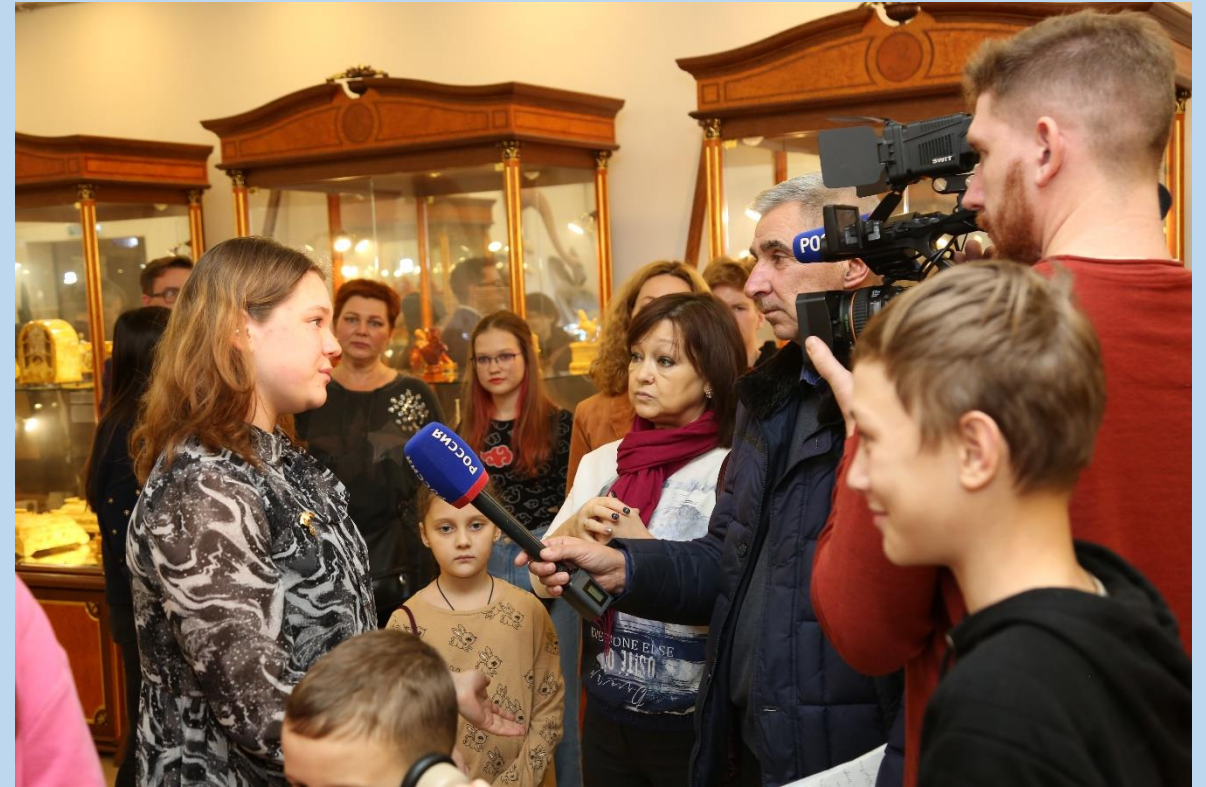
Презентация проекта в Музее янтаря