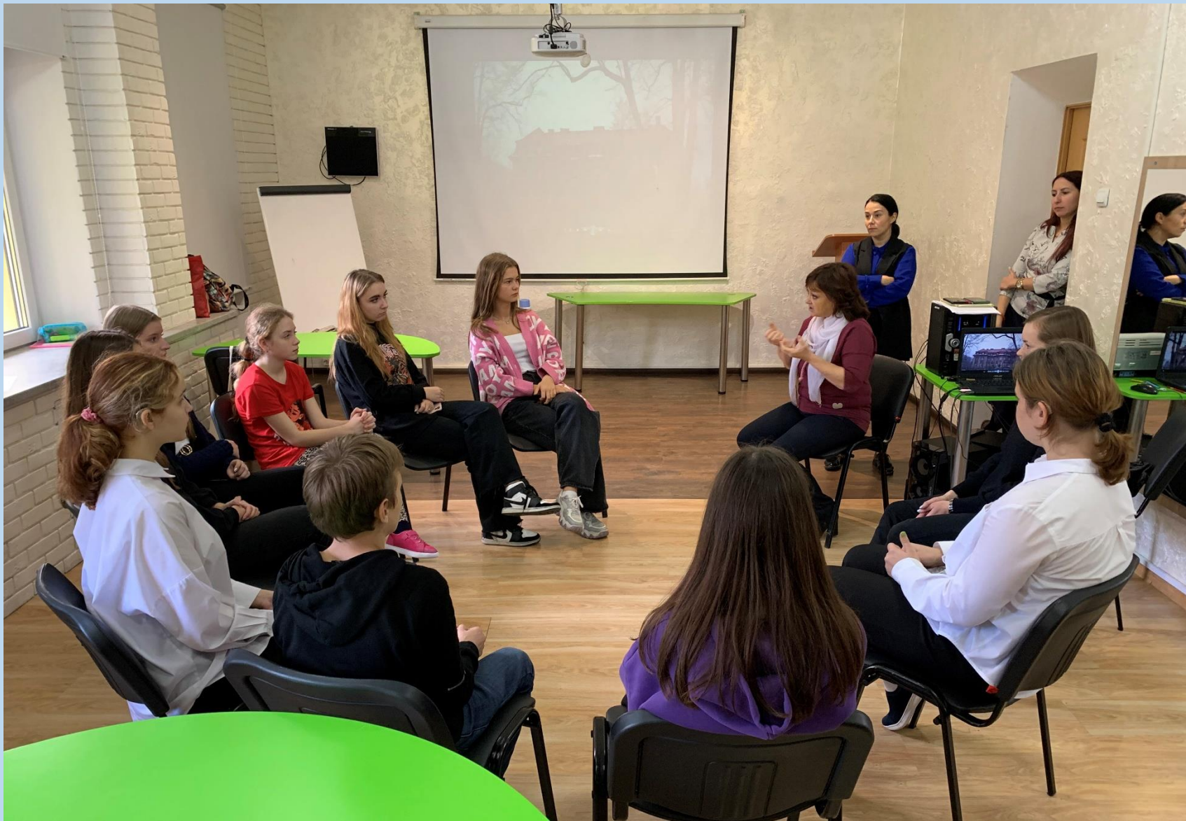
Представление проекта потенциальным участникам